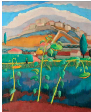
Trois soleils ou Tournesols, vers 1948-1949, huile sur toile, coll. part.