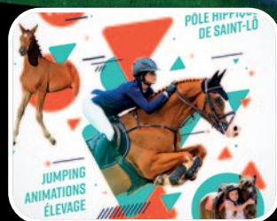
Normandie Horse Show