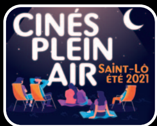
Cinés plein air

5 conteurs 1 troupe de théâtre et la complicité de Malice Comédie