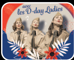
Bal de la Libération