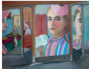
ATELIER MBA DINES Autoportrait au miroir à trois faces , s. d., huile sur toile, coll. part., © ADIN - Olivier Goulet

Découverte de l'exposition temporaire Madeleine Dinès, en toute intimité et de ses autoportraits puis réalisation de son autoportrait à partir d'une photo.