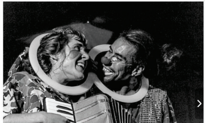
Dans le cadre du festival Les Hétéroclites, les artistes de la compagnie Le Bus Des Rêves viennent visiter cinq écoles saint-loises.